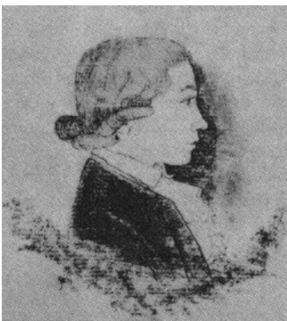
Der sechzehnjährige Hölderlin (nach einer Bleistiftzeichnung), seinen Ruhm zum 250. Geburtstag 2020 vielleicht vorausahnend?

Mit Blick auf den 250. Geburtstag im Jahr 2020 häuften sich seit Jahren die Sorgen um das arg verfallene, in Privatbesitz befindliche, nach wie vor stattliche Haus. Das jetzige Bauwerk kann zwar nicht mehr als Originalgebäude gelten, weil das alte Gemäuer bereits zu Beginn des letzten Jahrhunderts (unter viel Protest!) wegen Baufälligkeit abgerissen und