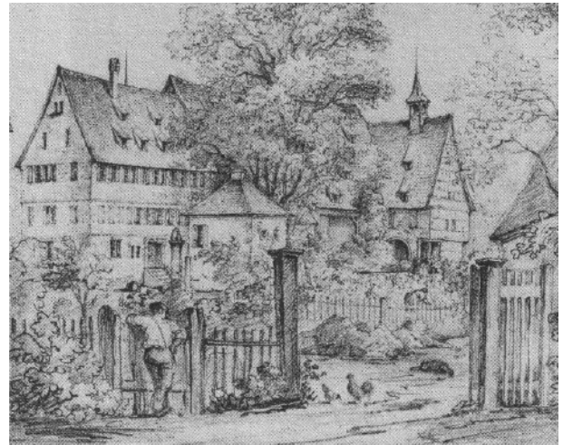
Klosteranlage mit dem Geburtshaus Hölderlins in Lauffen. (Bleistiftzeichnung von J. Nebel, um 1840)

in heutiger Gestalt neu errichtet wurde. Auf diesem Hintergrund richteten wir im Juni des Jahres unsere Anfrage an den Lauffener Bürgermeister Klaus-Peter Waldenberger.