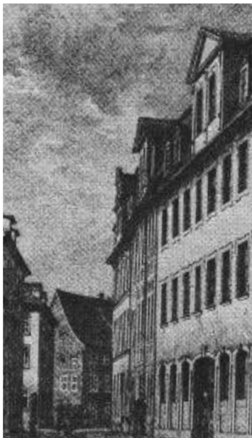
Die Windischenstraße in Weimar mit der Schillerwohnung im 1. Stock (vorn rechts). Nach dem Auszug des privaten Schillermuseums erinnert nur noch der steinerne Hinweis oberhalb der Tür „Hier wohnte Schiller 1799 bis 1802“ an den Dichter.

Noch vor kurzem hatten wir dem kleinen privaten Schillermuseum in der Weimarer Windischenstraße 8 unsere Glückwünsche übermittelt (siehe im letzten Tätigkeitsbericht S. 2). Im Mai 2009